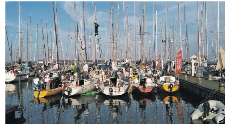
Uge 29 Ungdomscruise på Tunø, 16 både i alt i 3 rækker