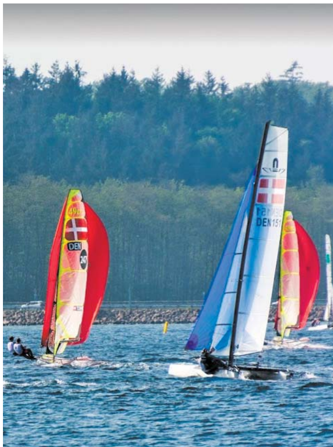
Haldor Topsøe Cup 2017