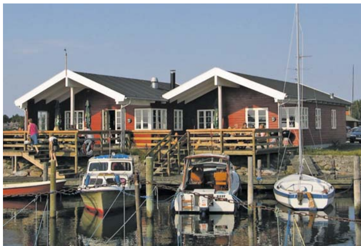
Klubhuset, Orø havn